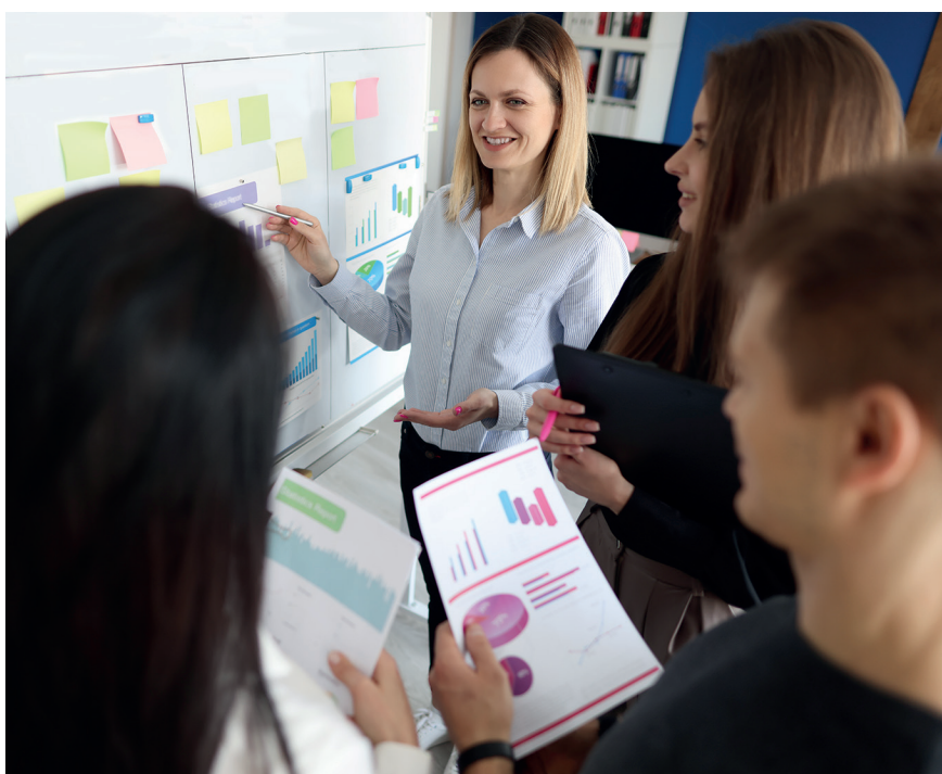
Ledarens roll är att stödja, coacha och träna medarbetarna i att ständigt åstadkomma och upprätthålla de bästa arbetsätten och processflödena.

När det gäller kvalitetsarbete och ledarskap betonar alla befintliga och historiska kvalitetsmodeller kraftfullt ledarskapets roll. Samtidigt visar mängder av studier att just ledarskapet också